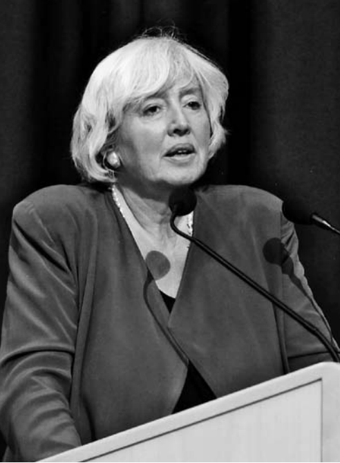
Bundesministerin Renate Schmidt, Berlin