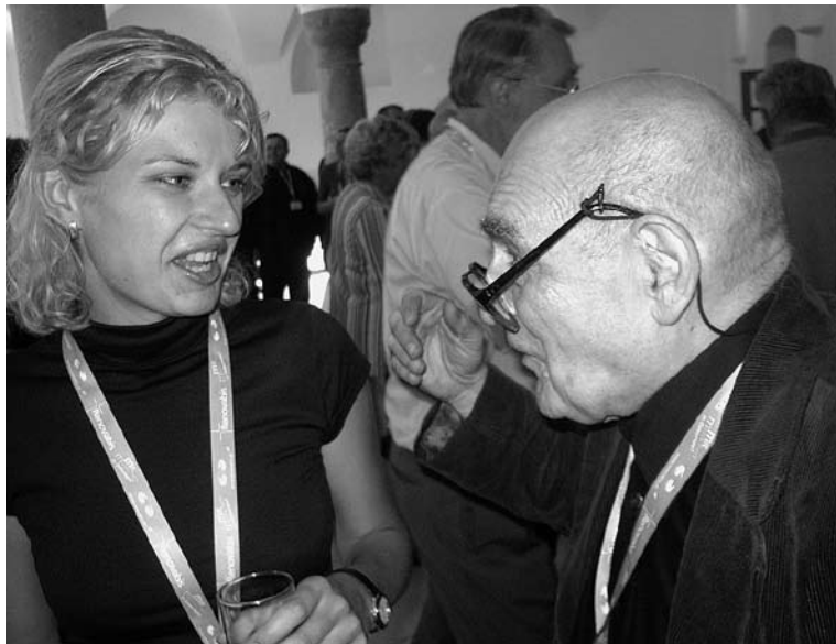
Generationen-Gespräch am Rande des Programms