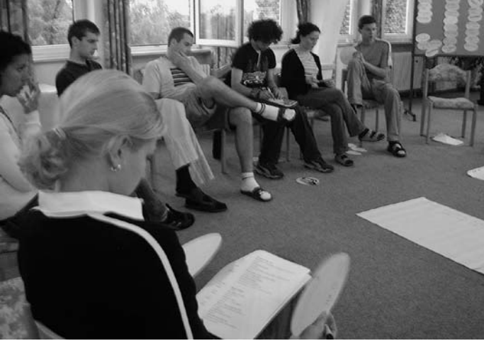
Gruppenarbeit im Workshop

Die Ergebnisse sind teilweise erschreckend und ernüchternd im Hinblick sowohl auf den Wissensstand Jugendlicher gegenüber der Union als auch auf die Partizipationsmöglichkeiten. Daher wurde der europäischen Politik auferlegt, dass die Union zuallererst in zwei Bereichen der Jugendpolitik wesentlich stärker als bisher tätig werden sollte, nämlich bei Jugendpartizipation und Jugendinformation . Ausgehend von dieser grundsätzlichen Zielrichtung wurden sowohl für die europäische als auch die nationalen Ebenen gemeinsame konkrete Maßnahmen entwickelt, damit Jugendpolitik wesentlich stärker als bisher als Querschnittspolitik betrachtet und verankert wird. Die Ministerien der einzelnen Länder in der EU haben sich beispielsweise auf eine intensivere Koordination ihrer Politiken in der Jugendpolitik verständigt.