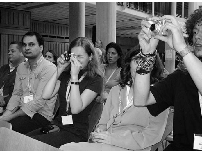
Teilnehmer des Jugendworkshops beim „Fototermin“: Begeisterung für Professor Bartoszewski